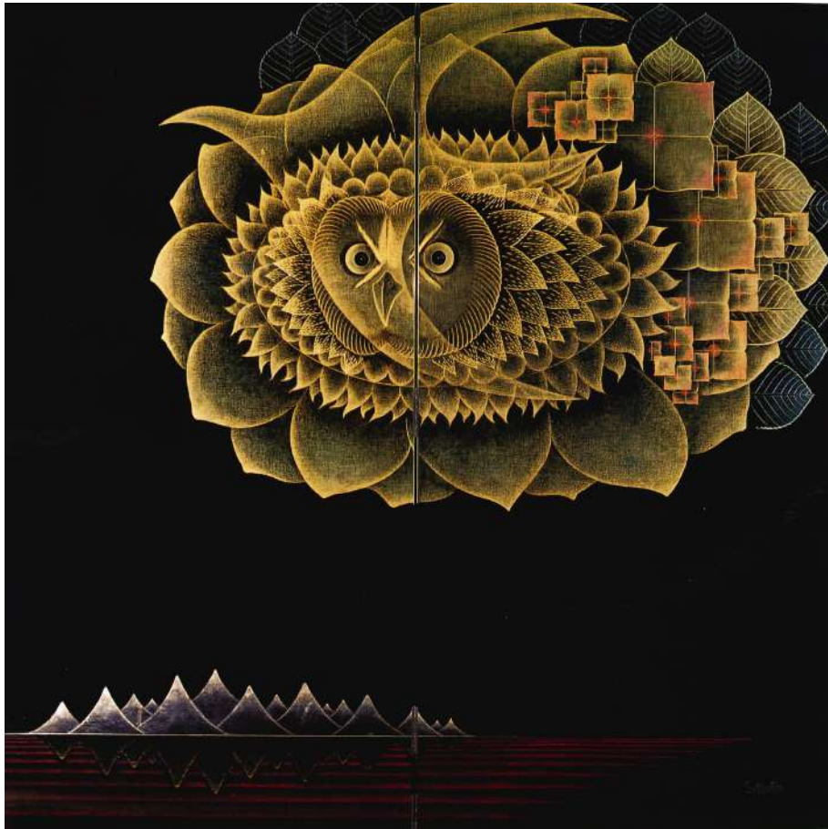
高橋節郎《金環の記》1973年