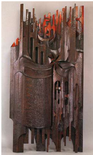
高橋貞夫《大地樹空》1997年 第29回日展 特選