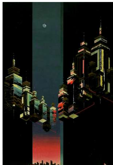
竹森公男《残照》2015年 改組新第2回日展 特選