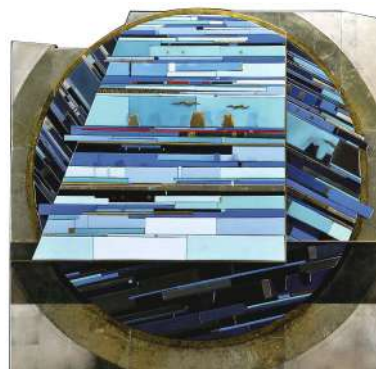
向山伊保江《つむぐ・杜》2018年 改組新第5回日展 特選